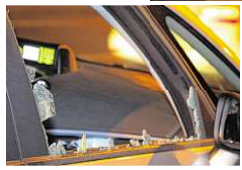
Die gesplitterte Seitenscheibe einer Funkstreife nach dem Übergriff

Unbekannte haben in Kreuzberg Fahrzeuge der Polizei mit Steinen beworfen. Dabei wurde in der Nacht zum Sonntag ein Uniformierter verletzt, außerdem entstand erheblicher Sachschaden. Die Täter konnten entkommen. Der Berliner Landesverband der Gewerkschaft der Polizei (GdP) verurteilte den Zwischenfall scharf. Nach Polizeiangaben war ein Fahrzeug des Zentralen Objektschutzes gegen 2 Uhr während der Fahrt durch die Köpenicker Straße von Steinen getroffen worden, als der Wagen in Höhe der Adalbertstraße fuhr.