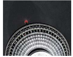
Restaurant und Bar befinden sich in der Kugel des Fernsehturms

MITTE – Der Berliner Fernsehturm hat sich für das Siegel „Servicequalität Deutschland Stufe 2“ zertifizieren lassen. 1000 Gäste wurden zum Leistungsangebot, dem Preis-Leistungs-Verhältnis, Atmosphäre und Ambiente befragt. Ergebnis: Note 1,4. Fast alle Gäste (94 Prozent) empfehlen den Turm weiter. Die Mitarbeiterbefragung zum eigenen Unternehmen ergab die Note 1,7. Und die Prüfung durch unabhängige Tester ergab „mit einer Gesamtnote von 1,1 ein hervorragendes Ergebnis“, teilte ein Sprecher des Unternehmens mit. bsm