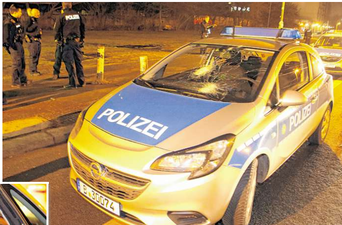
Die Scheibe eines Polizeifahrzeugs ist durch Steine zu Bruch gegangen

Der Vorfall zeige auch, wie wichtig es sei, alle Berliner Funkwagen mit Splitterschutzfolien zu schützen, weil es offensichtlich Leute gebe, „für die ein Polizist kein Mensch“ sei. Der SPD-Ab-