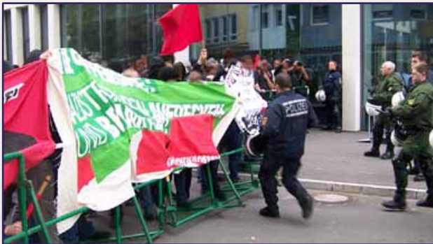
» Der 06.10.12 in Göppingen

Handeln , wenn Nazis auf die Straße gehen wollen – ob am 12. Oktober in Göppingen oder anderswo!