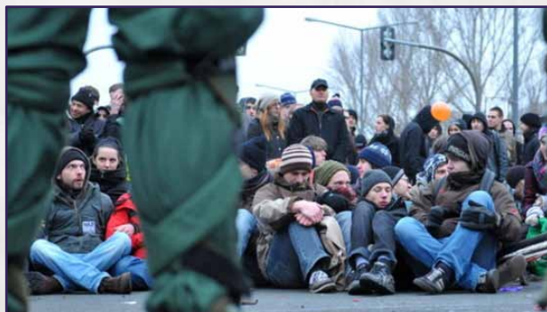
» Massenblockaden in Dresden 2011

Doch angekündigte Blockadeaktionen sind leider nicht immer erfolgreich. Denn wo Oberbürgermeis-