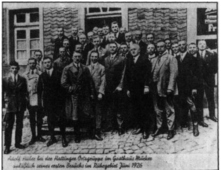
Adolf Hitler bei des Hattinger Ortsgruppe im Gasthaus Mäcker anlässlich seines ersten Besuchs im Ruhrgebiet Juni 1926

(Völkischer Weckruf, Kampf-blatt der SA im Ruhrgebiet, gefun-den im Briefkasten einer Hattin-gerin, die Nazi-Aufkleberabgeris-sen hatte).