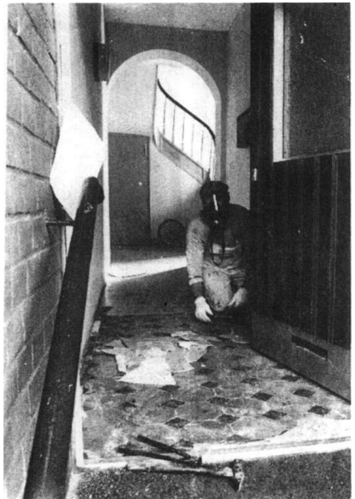
Mit Gasmasken entfernten Handwerker den Fußbodenbelag nach einem Anschlag mit Benzylchlorid.