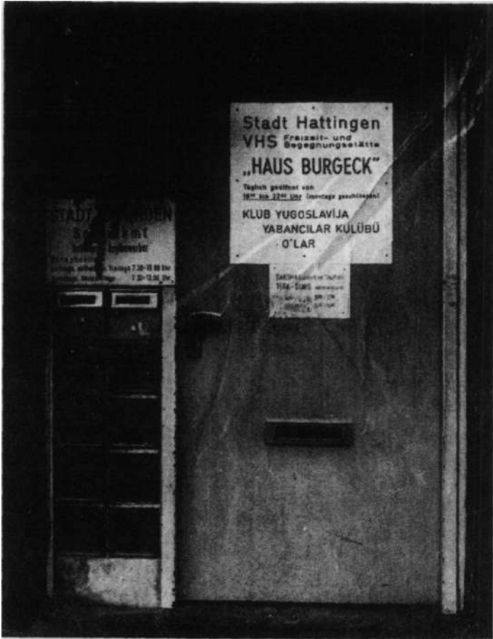
Durch den Briefschlitz der Ausländerbegegnungsstätte wurde das „Tränengas“ gekippt.