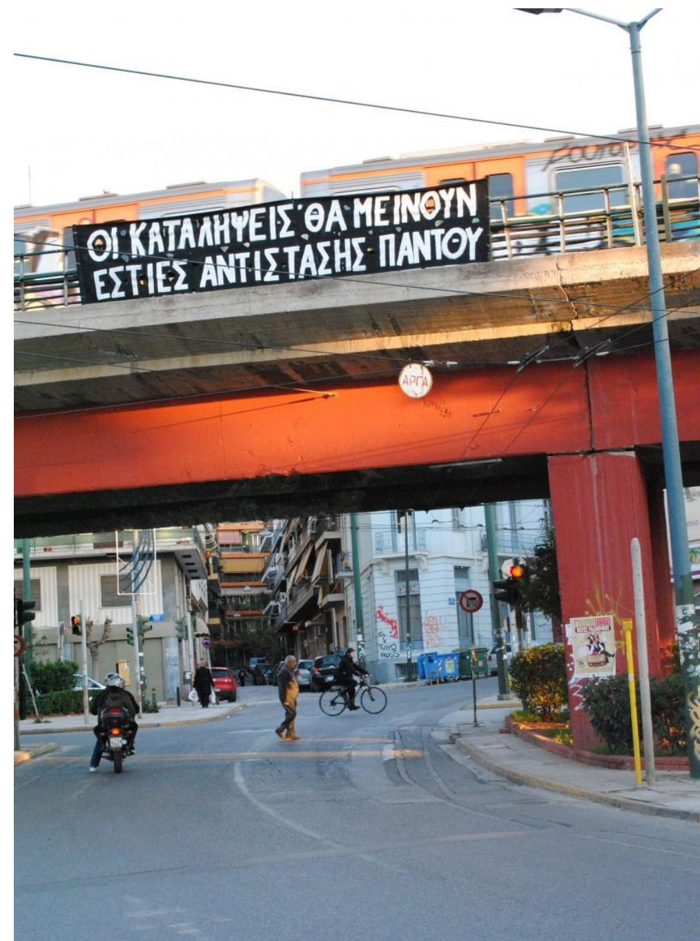
Recent banner drop from squatters, comrades and solidarian residents in Petralona, Athens: 'SQUATS WILL STAY! FOCI OF RESISTANCE EVERYWHERE!'