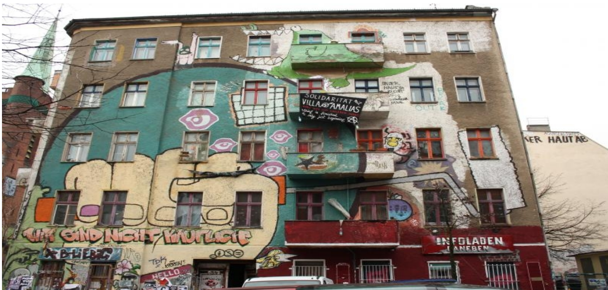
„Solidarität mit Villa Amalias.....“

den momentan existierenden Gewaltverhältnissen und von kapitalistischer Fremdbestimmung Ausdruck zu verleihen. Ein anderer Weg, auf dem Unterdrückung, sowie autoritätshörige Formen des Zusammenlebens überflüssig werden, ist möglich.