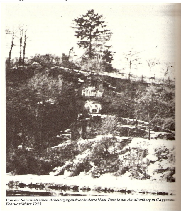
Von der Sozialistischen Arbeiterjugend veränderte Nazi-Parole am Amalienberg in Gaggenau. Februar/März 1933

Bei der Reichstagswahl 1930 gelang es der NSDAP zweitstärkste Partei hinter der SPD zu werden. Bei den Arbeitern war der Einfluss der NSDAP aber gering, so konnten sie in den Betrieben wie 1931 im Benz Werk Gaggenau gerade einen Sitz in Betriebsrat gewinnen. Die Stimmen der NSDAP stammten dabei fast nur von den Verlusten der bürgerlichen Parteien, währenddessen die Anzahl der Stimmen der SPD und KPD stabil blieben. Bei den Wahlen 1932 erhielt übrigens die KPD mehr Stimmen als die SPD im Bezirk Rastatt. Die Fackelzüge der Nazis in der Region liefen meist ohne Proteste ab. Bekannte Gegenaktion in Gaggenau waren, dass parallel zu einem Aufmarsch der SA antifaschistische Parolen am Eisenwerk angebracht wurden. Die selbe Gruppe, der sozialistischen Jugend, ergänzte unter Einsatz ihres Lebens die Naziparole "wählt Hitler" mit "ihr Esel" auf dem Gaggenauer Amalienberg.